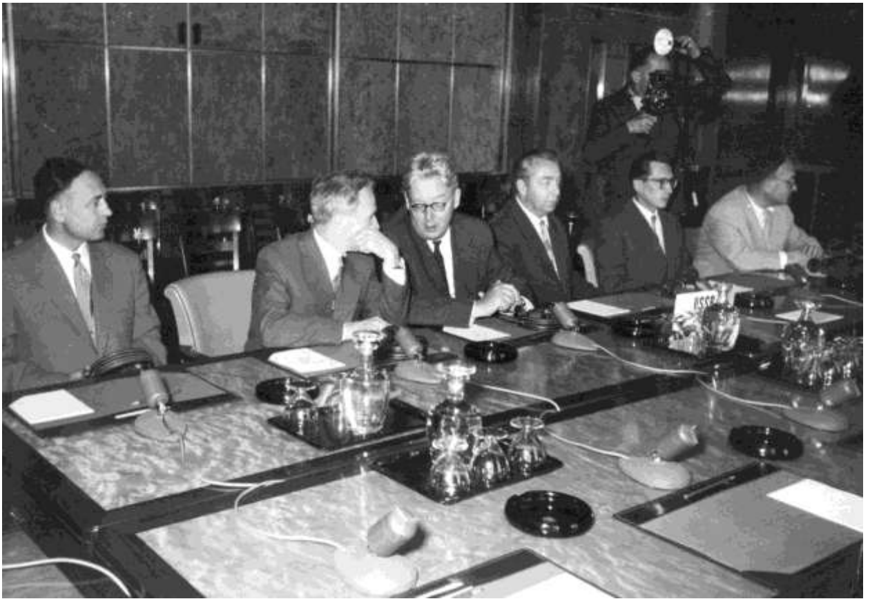
Женевское совещание по запрещению испытаний ядерного оружия, 1958 г.