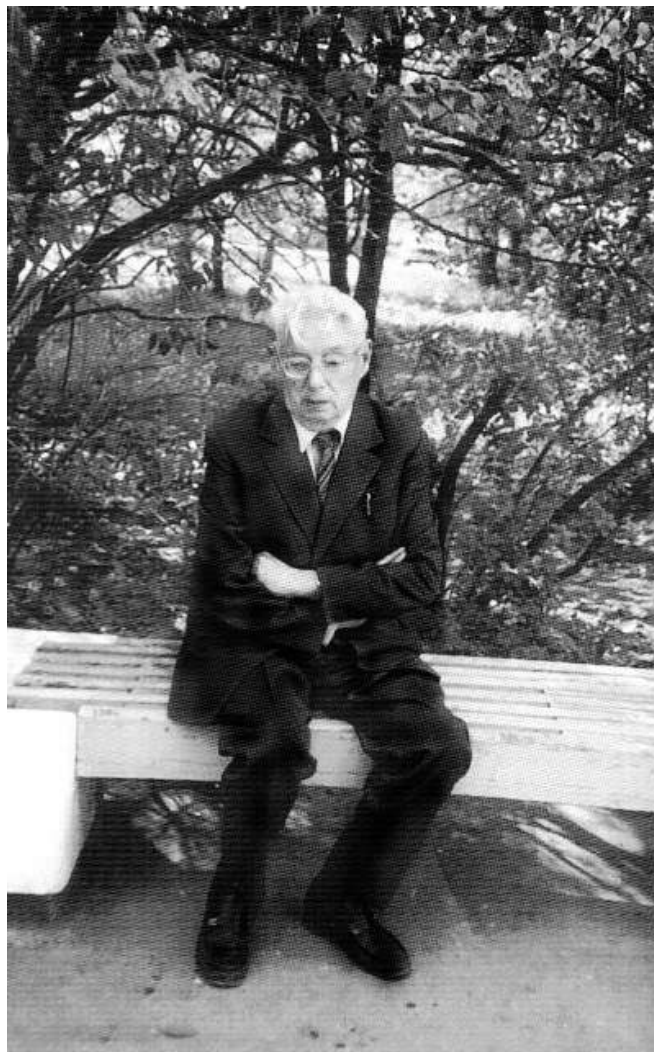
Тбилиси, 1975 г.