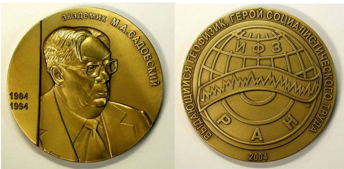
Памятная медаль им. М.А. Садовского, 2008 г.