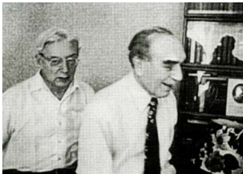
М.А.Садовский, Н.Н.Семенов, 1970-е гг.