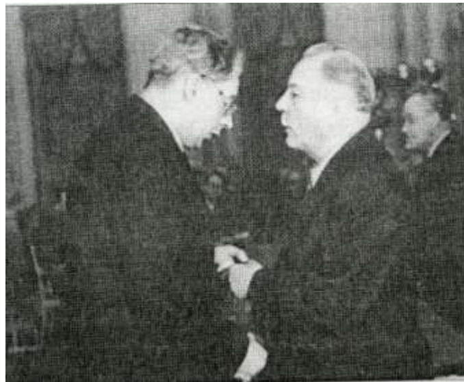
К.Е.Ворошилов, М.А.Садовский, 1950-е гг.