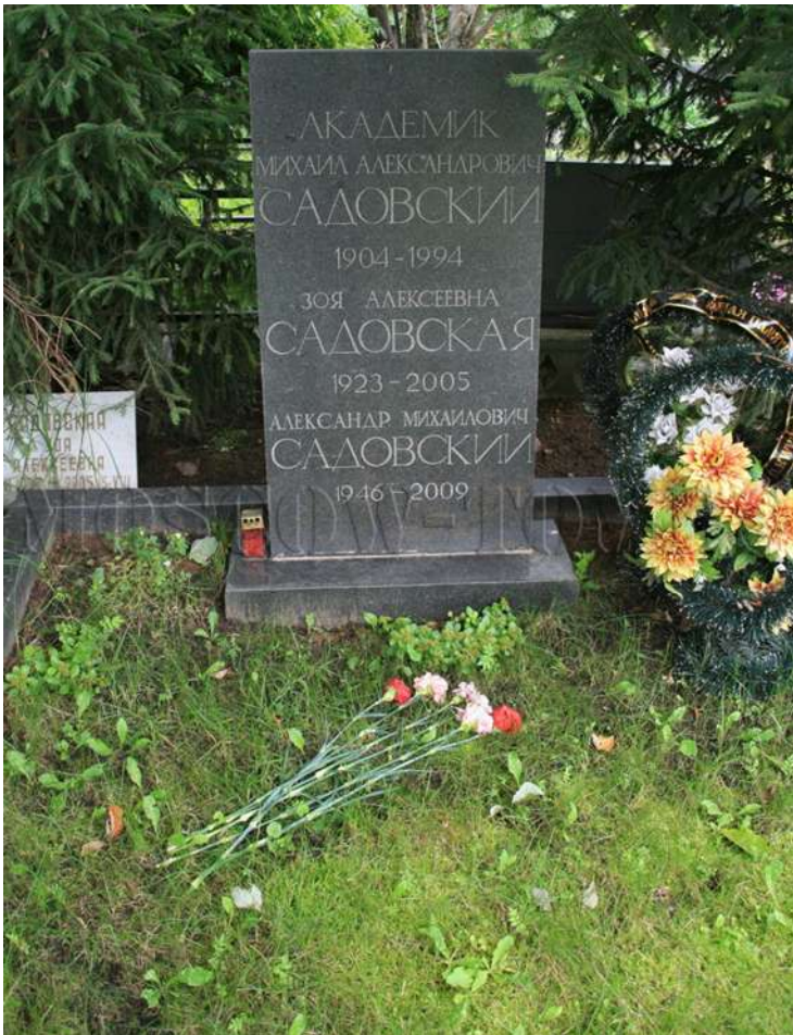
Могила Садовских на Троекуровском кладбище, Москва