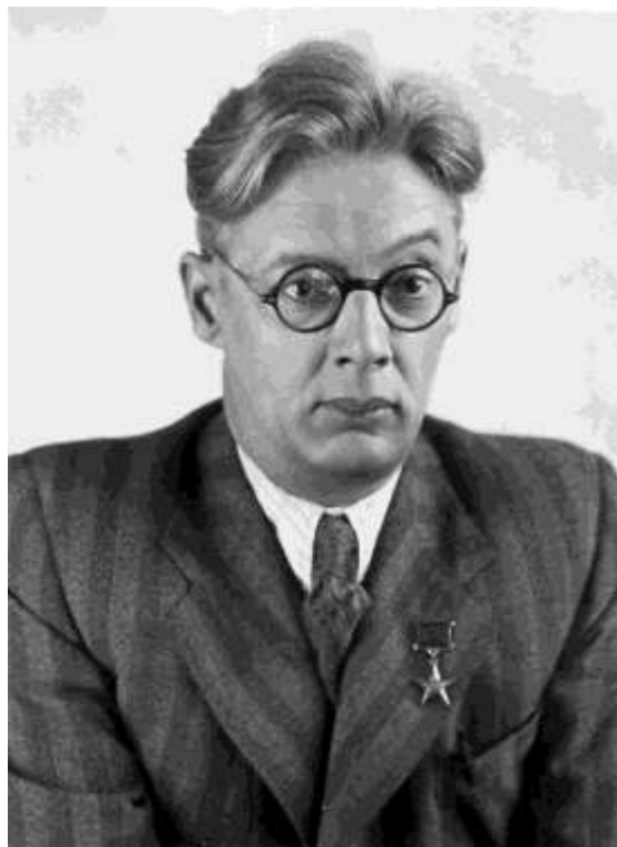
М.А.Садовский, 1930-е гг.