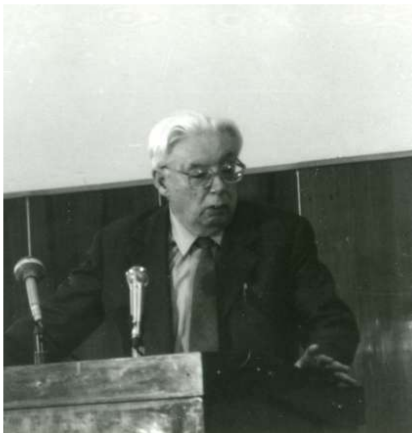
На объединенном юбилее Ю.Б.Харитона и Я.Б.Зельдовича, 1984 г.