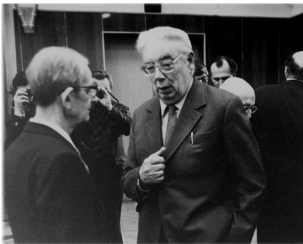
Ю.Б.Харитон, М.А.Садовский, 1984 г.